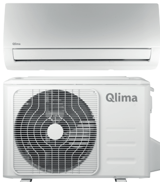
Luftvärmepump SC-JA 4819